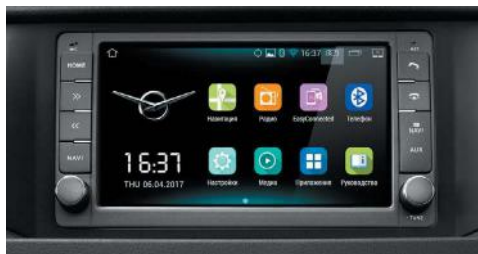
Современная мультимедиа система